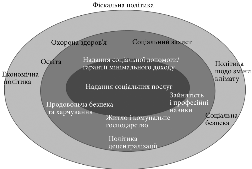
Рис. 2. Інтегрована багаторівнева система соціальної підтримки населення

можна низку послуг об'єднати в єдину програму, що буде поєднувати активні та пасивні заходи на ринку праці, включно з консультаціями щодо працевлаштування, перенавчання, наданням рекомендацій з приводу можливих соціальних пілг та допомог, підтримкою щодо розв'язання соціальних проблем, зокрема пов'язаних зі здоров'ям.