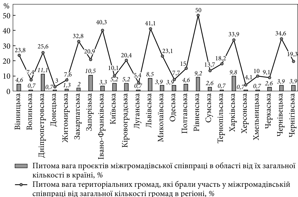
Рис. 2. Міжгромадівська співпраця в регіональному розрізі, 2022 р.; дані з дня набуття повноважень територіальними громадами після виборів у 2020 р.