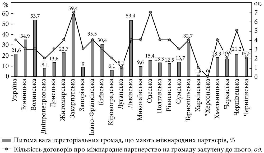
Рис. 3. Міжнародне співробітництво територіальних громад України, 2022 р.; *дані відсутні; **верифікована інформація приблизно по 50 % українських територіальних громад, за винятком тих, які знаходяться в окупації, в зоні бойових дій або близько до такої зони

нерстві, що пояснюється (крім активної діяльності їх керівництва у цьому напрямі) ще й близькістю розташування до країн ЄС. У Закарпатській, Львівській, Чернівецькій та Одеській областях на територіальну громаду, яка має партнерів за кордоном, припадає в середньому по 5—6 партнерств.