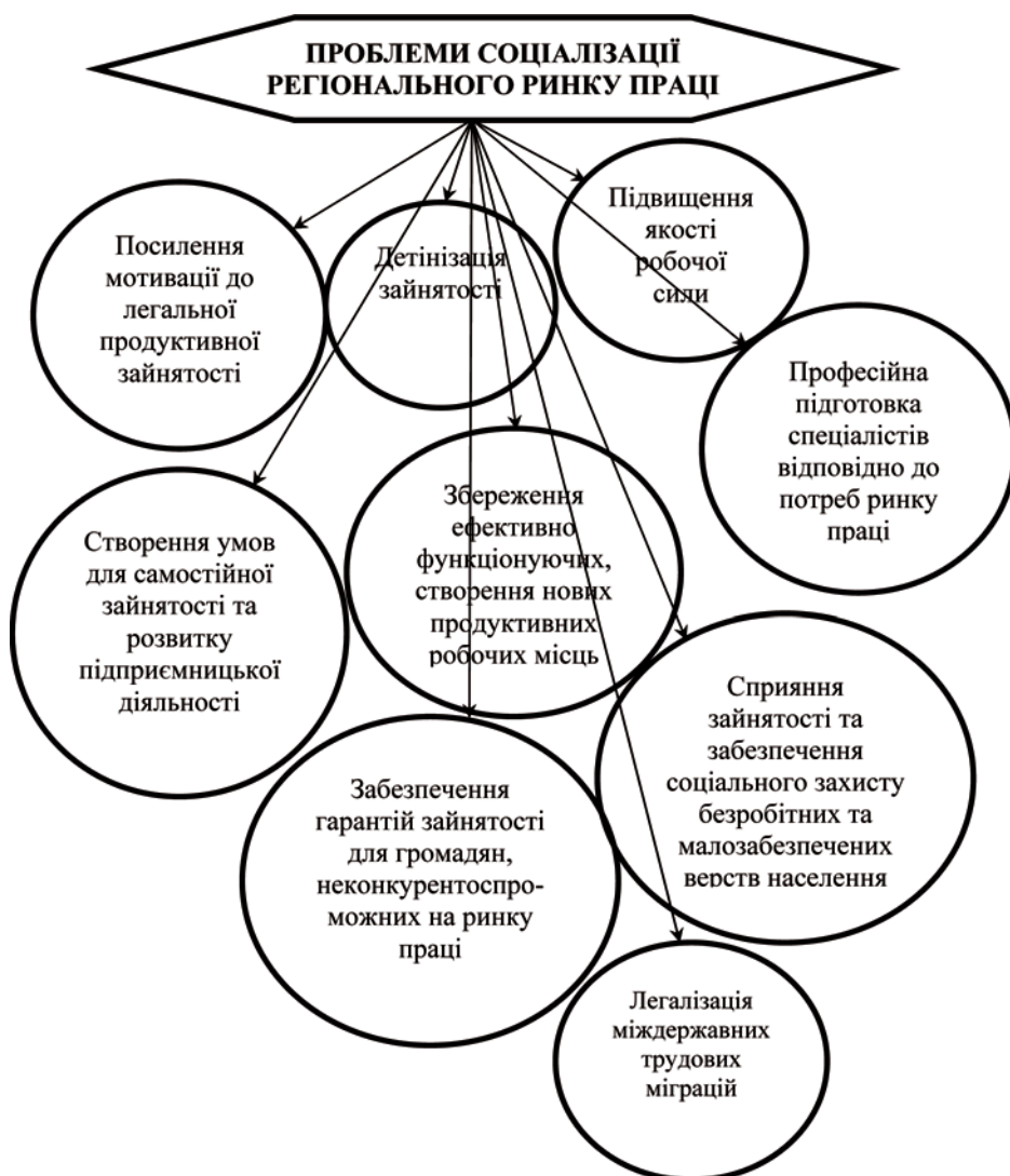
Рис. 2. Проблеми соціалізації ринку праці, які залишаються невирішеними

праці нижче або на рівні прожиткового мінімуму. Понад 1/3 працюючих в області у 2006 р. отримували заробітну плату у розмірі до 600 грн., чого не вистачало на повноцінне харчування одного працівника, не кажучи про сім'ю, сплату комунальних послуг, житла тощо. 41,3% працівників отримували заробіток від 600 до 1250 грн., що забезпечувало пріоритетні потреби на рівні фізичного виживання, проте такий заробіток не створював матеріальних можливостей для лікування, оздоровлення, постійного освітньо-професійного розвитку за власні кошти, не говорячи про придбання житла або навіть погашення довгострокового кредиту на житло [7].