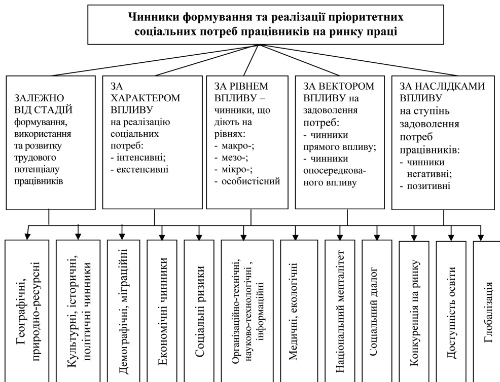
Рис. 1. Класифікація чинників, що впливають на формування та реалізацію пріоритетних соціальних потреб працівників на ринку праці

Зміну пріоритетних соціальних потреб працівників обумовлюють зміни у матеріальному добробуті, стані соціальної захищеності, умовах праці, духовних цінностях тощо. Зауважимо, що процес формування та реалізації пріоритетних соціальних потреб працівників є дуже складним, він відбувається під впливом багатьох чинників (рис.1).