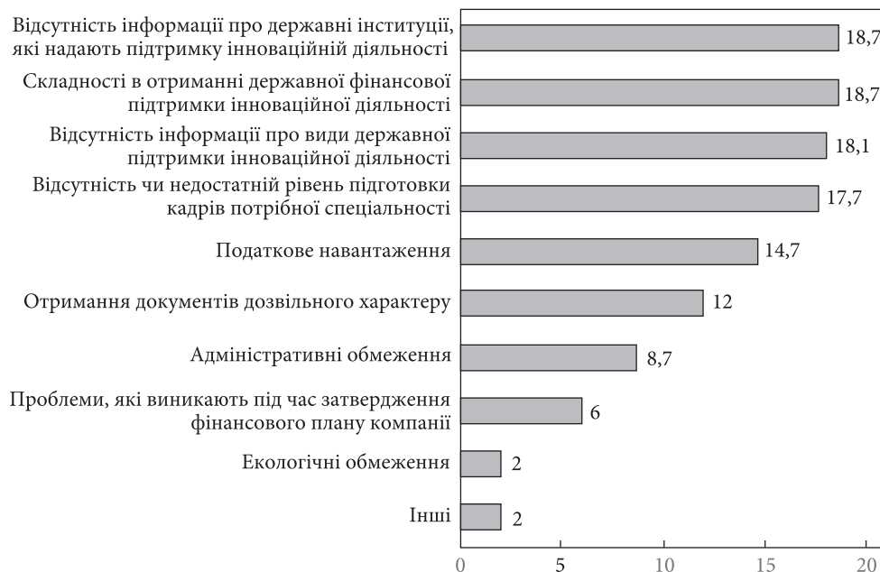
Рис. 4. Основні бар'єри щодо інноваційної активності бізнес-компаній в Україні за результатами опитування, січень-лютий 2020 р., %