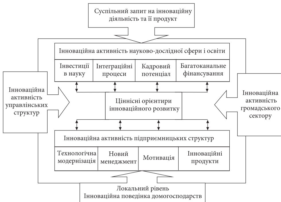
Рис. 5. Утвердження орієнтирів інноваційного розвитку в суспільстві

Висновки. Ціннісні орієнтири інноваційного розвитку та сформована на їх основі активність суб'єктів є важливим вектором розвитку держави, незалежно від її суспільно-політичних та соціально-економічних особливостей. За сучасних умов посилюється залежність інноваційних параметрів розвитку від рівня інституційної довіри у суспільстві. Наявність потенціалу міцних і взаємовигідних зв'язків, сформованих на засадах відповідальності і довіри, сприяє зростанню інноваційної активності суб'єктів завдяки успішному управлінню можливими ризиками та поліпшенню адаптації до змін у зовнішньому середовищі. Вочевидь, що посилення їх взаємозалежності можна розглядати як певну закономірність сучасних трансформаційних змін у суспільному житті, врахування якої в державній політиці відкриє нові можливості для інноваційного розвитку. За умов зростання інституціональної довіри в українському суспільстві, посилення продуктивних соціальних зв'язків можна очікувати на прискорення процесів інноватизації різних сфер суспільного буття.