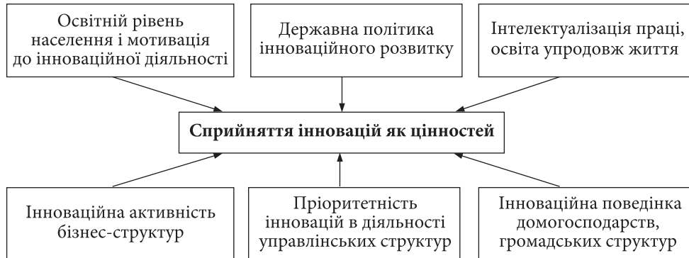
Рис. 1. Залежність сприйняття інновацій від середовища їх формування

суб'єктів (управлінські структури, інвестори, суб'єкти підприємництва, вищі навчальні заклади, наукові установи, громадськість) набуває пріоритетного значення. Кожен із зазначених суб'єктів активно впливає на нього, здійснюючи залежно від своїх компетенцій розробку нових технологій та продуктів, фінансування інноваційної діяльності, проведення наукових досліджень чи підготовку кадрів, експертизу інноваційних проектів тощо. В узагальненому вигляді найвпливовішими чинниками є: