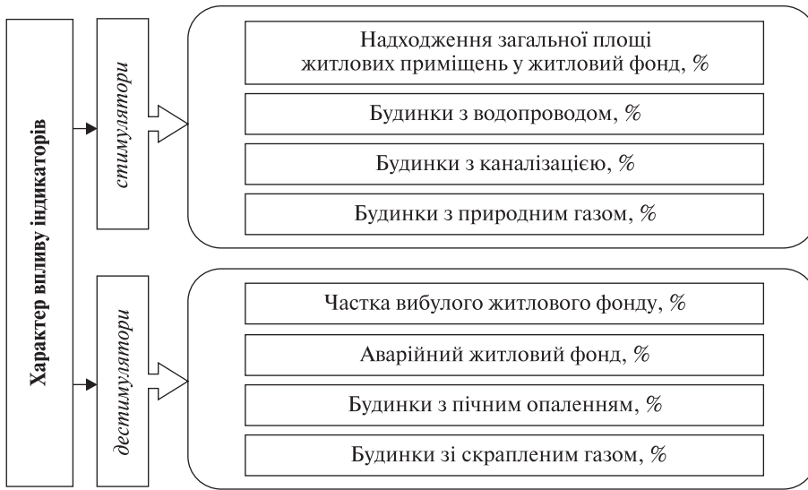
Рис. 1. Індикатори облаштування житлового фонду у сільській місцевості