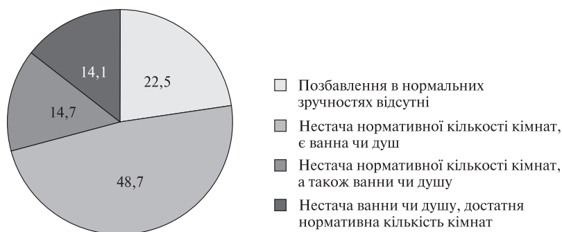
Рис. 2. Позбавлення домогосподарств нормальними житловими умовами