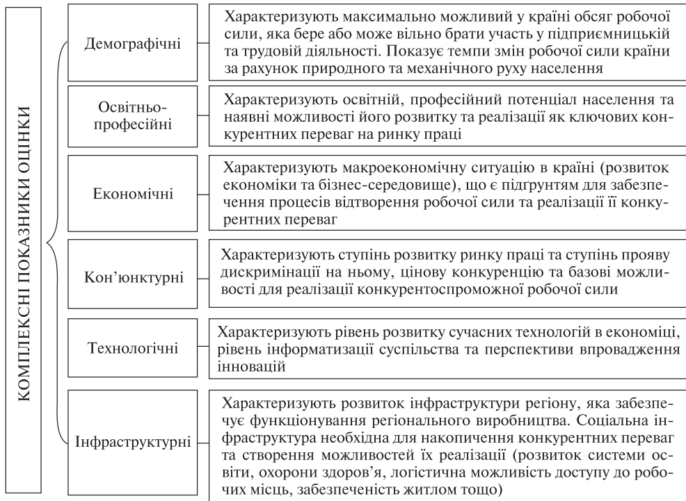
Рис. 2. Групування комплексних показників оцінки конкурентоспроможності робочої сили