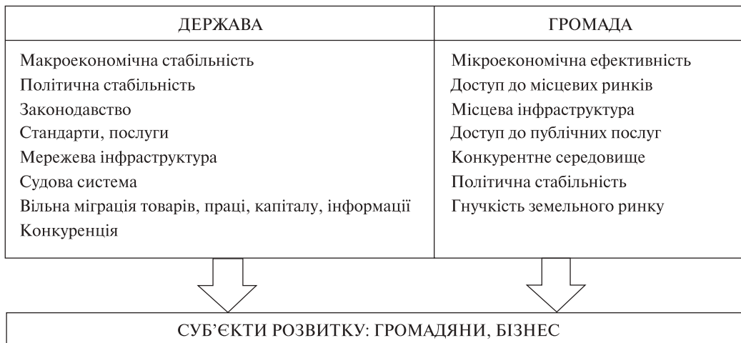
Рис. 1. Чинники впливу держави та громади на розвиток країни та складових її територій

Інституціональна слабкість держави дає змогу місцевим елітам «сильних» громад отримувати ренту від близькості до місцевої влади, а також вимагати її від держави, підживлюючи корупцію, спотворюючи ринкове середовище, поглиблюючи нерівність у розподілі ресурсів і доходів уже на національному рівні. Зруйнувати такі взаємовідносини «слабка» держава самостійно не спроможна, тому за таких обставин «слабка» держава часто звертається до «сильних» держав чи міжнародних інституцій по допомогу у розв’язанні власних проблем (екзогенне втручання). Громади з низьким потенціалом розвитку (слабкі), особливо подрібнені, втрачають можливість бути почутими «слабкою» державою і опиняються на периферії розвитку (табл. 1).