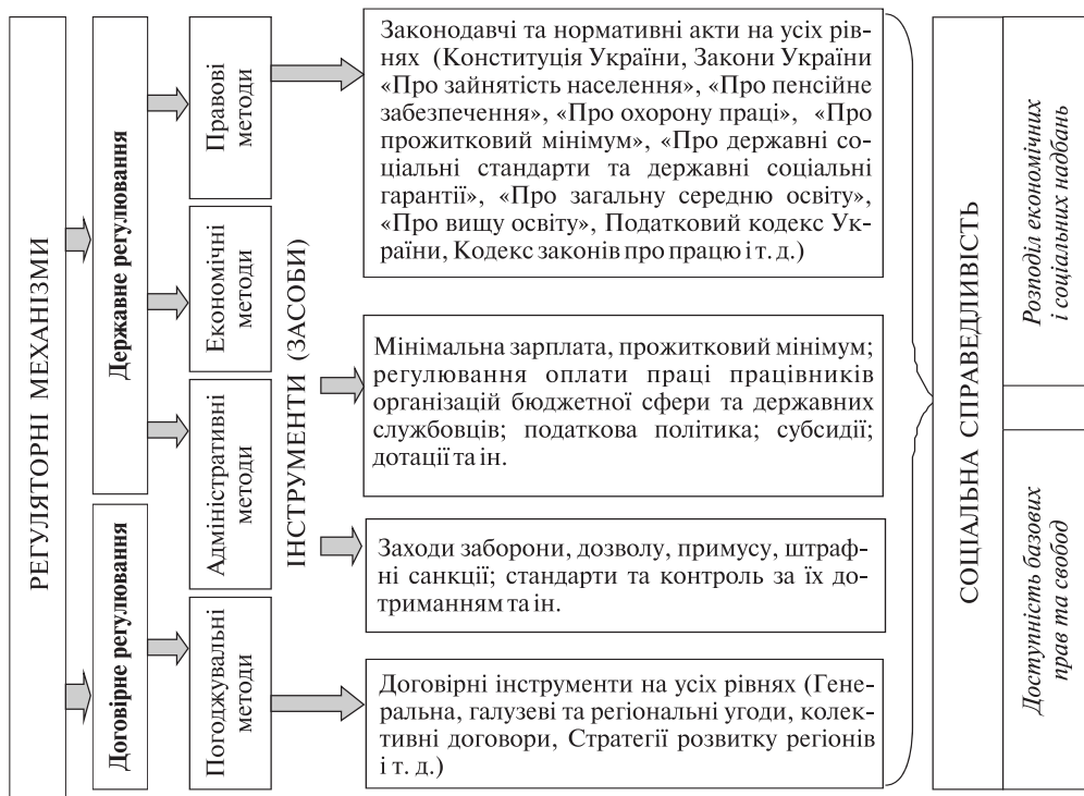
Рис. 3. Регуляторні механізми забезпечення соціальної справедливості