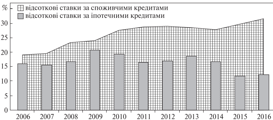
Рис. 2. Динаміка відсоткових ставок комерційних банків за споживчими та іпотечними кредитами у національній валюті (середньозважені за рік), %

Сучасні реорганізаційні зміни в банківській системі України, на жаль, не сприяють зміцненню системи інституційного захисту заощаджень домогосподарств, зростанню доступності кредитних ресурсів для фізичних та юридичних осіб, а відтак не забезпечують виконання важливих функцій банківського сектору відносно споживачів його послуг. Для переважної більшості як суб'єктів підприємництва, так і економічно активного населення ставки за кредитами є надзвичайно високими і перевищують реальну платоспроможність потенційних позичальників. Необхідно зазначити, що з 2009 р. фактичний розрив у величині процентних ставок комерційних банків за споживчими та іпотечними кредитами у національній валюті лише зростає (рис. 2).