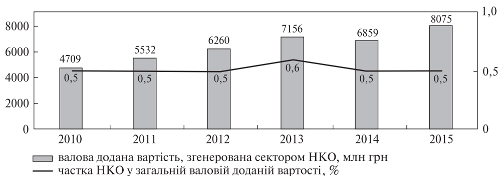
Рис. 3. Позиціонування сектору некомерційних організацій у валовій доданій вартості в Україні