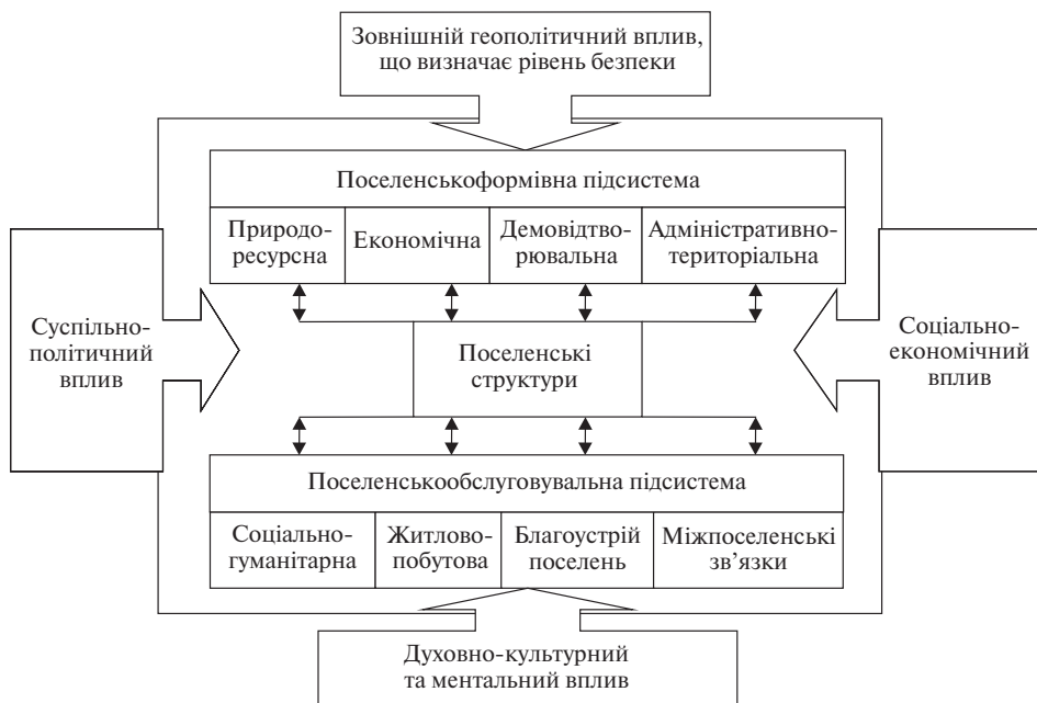
Рис. 1. Сільське розселення як трансформаційна система

У зазначеній трансформаційній системі саме територіальна локалізація структурних і функціональних зрушень визначає пріоритети управлінських рішень щодо необхідності адміністративно-територіальних змін, стимулювання процесів формування нового бізнес-середовища, а у підсумку – перспектив розвитку сільських територій, де в Україні мешкає понад третина населення. В оцінці сучасних трансформаційних змін поселенської мережі потрібно враховувати, що територія України заселена доволі нерівномірно, щільність населення змінюється у значному діапазоні на тлі депопуляційних тенденцій і процесів старіння населення. Винятком з цієї тенденції є п'ять областей (Закарпатська, Івано-Франківська, Рівненська, Тернопільська, Чернівецька), в яких чисельно переважає сільське населення і відповідні форми організації їх життєдіяльності. В Україні протягом 1990–2014 рр. сільське населення зменшилось на 2 млн 879 тис. (17 %). За цей період у Чернігівській області таке скорочення перевищило 40 %, у Сумській – 32 %; у західних областях країни воно було в межах 3,9–12,3 %.