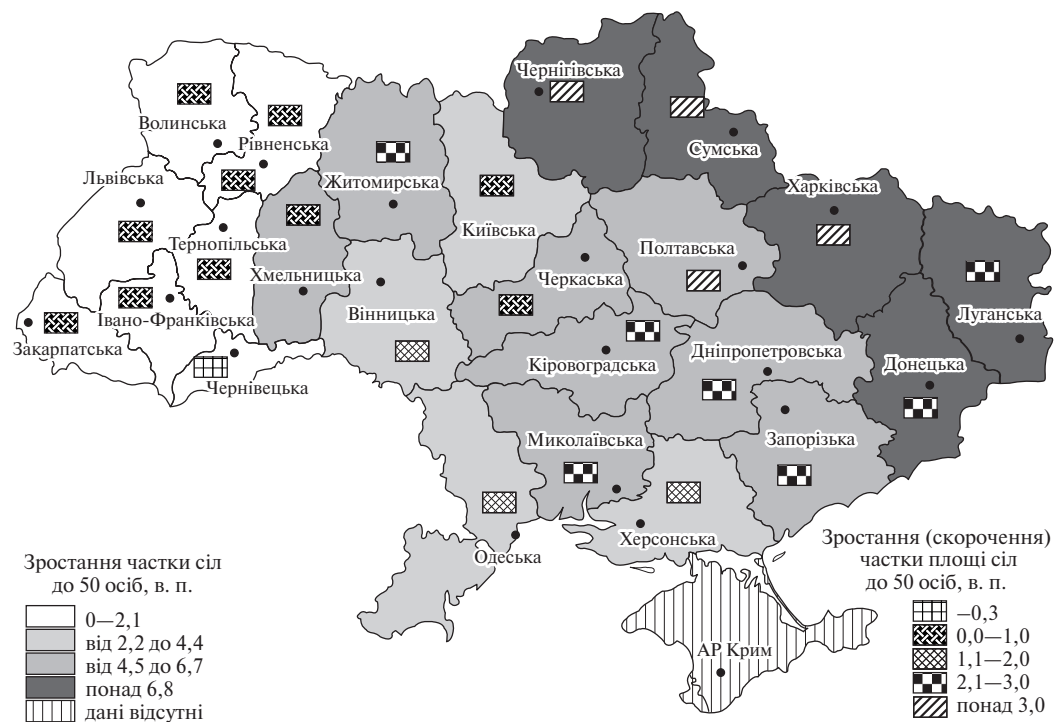
Рис. 2. Здрібнення сільських поселень в областях України, 2001–2014 рр.

Враховуючи сформовану динаміку соціально-демографічного розвитку, значне ускладнення інвестиційних умов, необхідних для відтворення економічного потенціалу сільських поселень, констатуємо, що переважна більшість із них перебуває на межі деградації. Можна очікувати, що процес інтенсивного здрібнення сільських