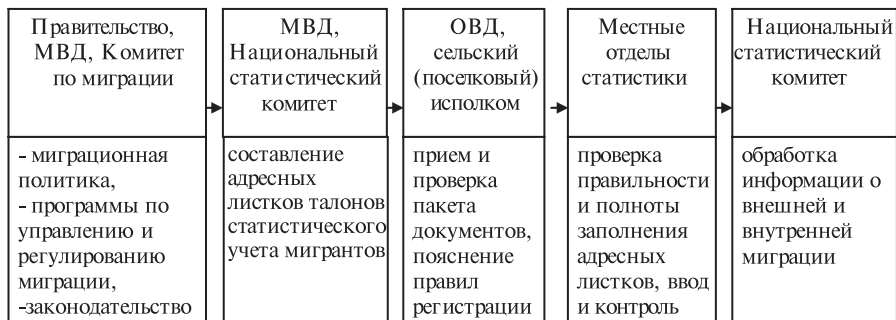
Рис. 1. Схема миграционного учета населения в Республике Беларусь

Миграционный учет в Республике построен по следующей схеме, которая позволяет наглядно представить порядок регистрации мигрантов (рис. 1).