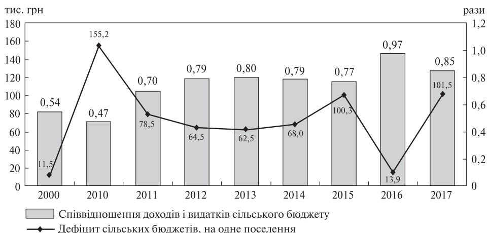
Рис. 1. Співвідношення доходів і видатків сільських бюджетів в Україні, 2000, 2010–2017 рр.

З початком реалізації адміністративно-територіальної реформи у органів місцевого самоврядування з'явилась можливість покращити фінансові показники. Загалом упродовж 2010–2017 рр. доходи сільських бюджетів зросли у чотири рази, а видатки – у 2,2, що позначилось на співвідношенні доходів та видатків місцевих бюджетів, яке зросло з 0,47 разів на початку періоду до 0,85 – наприкінці (рис. 1). Зазначимо, що в останні два роки (2016–2017) співвідношення доходів та видатків у сільських бюджетах було найкращим за період з 2000 р.: доходи покривали витрати на 97,2 та 84,7 % відповідно (для порівняння, у 2000 р. – на 53,6 %, 2010 – 47,4). Зниження дефіцитності сільських бюджетів обумовлено зменшенням рівня централізації доходної бази та зростання ролі місцевих бюджетів у фінансовому забезпеченні потреб громади.