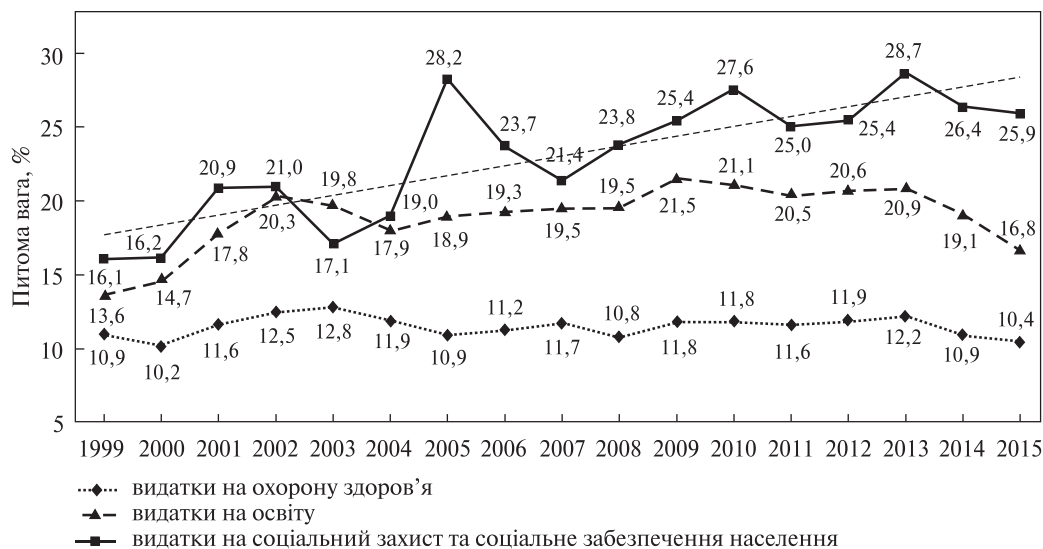
Рис. 3. Зміна питомої ваги соціальних видатків у загальному обсязі видатків ЗБУ в 1999–2015 рр.