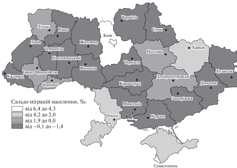
Рис. 1. Середні показники сальдо міграцій населення України в регіональному розрізі у 2010–2013 роках