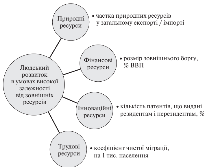
Рис. 1. Ресурсні детермінанти незбалансованого людського розвитку та індикатори оцінки