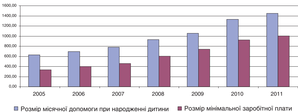
Рис. 3. Динаміка допомоги при народженні першої дитини та мінімальної заробітної плати в Україні у 2005–2011 рр. * Примітка. Середньомісячний розмір допомоги при народженні першої дитини розраховано з врахуванням суми одноразової виплати та щомісячних платежів протягом першого року. Розмір мінімальної заробітної плати взято станом на 31 грудня поточного року.

Хоча частина населення України позитивно оцінює запровадження вагової державної допомоги при народженні дитини, світова практика свідчить про низьку ефективність таких заходів, адже за значних затрат досягається незначне підвищення показників народжуваності, причому в короткостроковій перспективі. Монетарне стимулювання дітонародження використовують у високорозвинутих країнах (Швеція, Данія), проте у поєднанні з іншими інструментами соціальної політики.