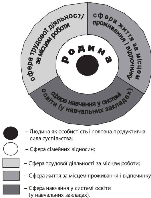
Рис. 1. Квадра сфер життєдіяльності людини, де вона має потребу самореалізуватися

Перший (залежно від особистих вимог може бути і другим) – це достатня матеріальна винагорода за працю з метою задоволення фізіологічних та інших потреб.