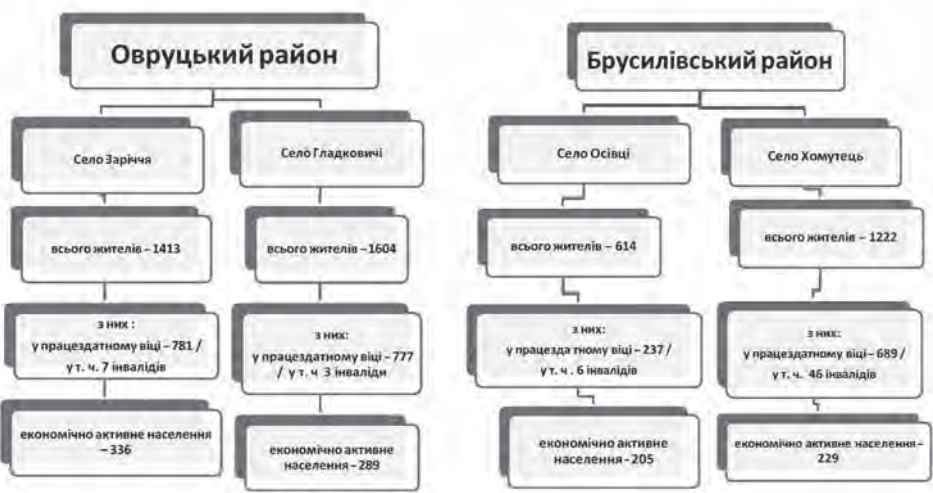
Рис. 1. Структура населення, осіб

Графічне відображення розподілу працездатного населення за віковими групами (рис. 2) показує, що трудовресурсний потенціал досліджуваних сіл характеризується значною часткою економічно високоактивного контингенту, а саме частками осіб у віці 35–54 роки (45,3 % – с. Хомутець, 47,7 % – с. Гладковичі, 50,9 % – с. Осівці, 52,5 % – с. Заріччя) та 28–34 роки (від 19,3 % у с. Хомутець до 22,4 % – у с. Гладковичі).